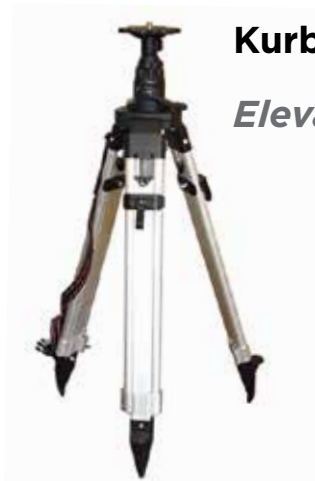
Kurbelstativ für den Bau