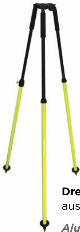
Dreibeinstativ aus Aluminium

New at proNIVO: Professional moisture measuring instruments from Protimeter. Proven for a long time: Tripods and other accessories for construction surveying.